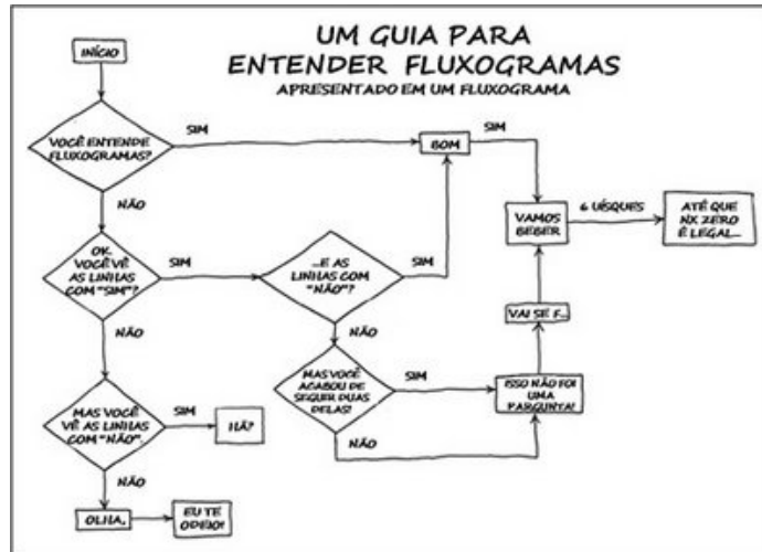
Figura 2: Um guia para entender fluxogramas

A Figura 2 apresenta, no exemplo de fluxograma, como agir em caso de problemas com os equipamentos do orientador!! Este fluxograma foi adaptado da Fonte, como a mesma explicita.