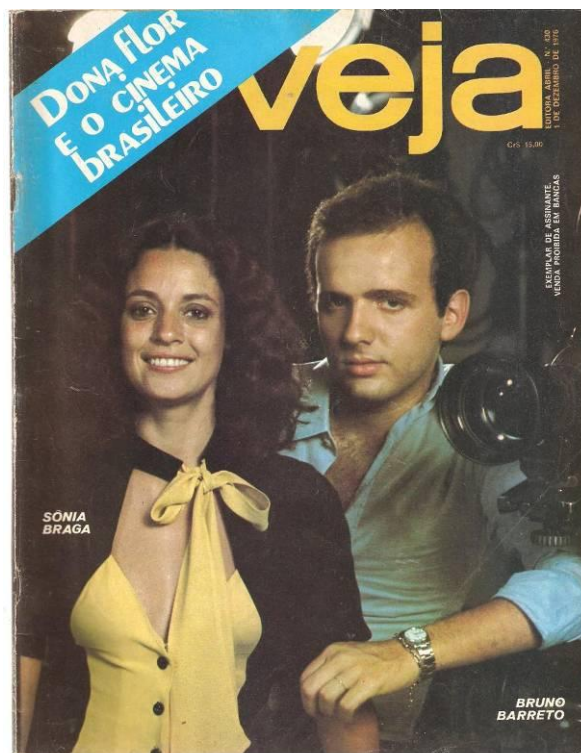
Figura 1 - Capa da edição 340 da revista Veja , de 1 de dezembro de 1976.

Veja expõe a polêmica gerada pelo filme que, mesmo tendo passado mais de trinta anos, ainda é considerado ousado sob o ponto de vista de muitos espectadores. Por imposição da censura da época, o grande público não assistiu à versão integral de Dona Flor , que sofreu dois cortes de imagem e um de som. Como se não bastasse, a censura federal do Paraná apreendeu quase vinte metros de filme, fazendo com que a sincronização da imagem com a trilha sonora se perdessem. Entretanto, o longa consagrou o diretor que, na época, tinha apenas vinte e um anos e se valia da literatura para produzir seus filmes pela terceira vez 3 , pois acreditava que “o cinema significa sobretudo um modo de preservar a nossa identidade cultural, os hábitos e costumes do povo” (REVISTA VEJA, ed. 430, 1976, p.85).