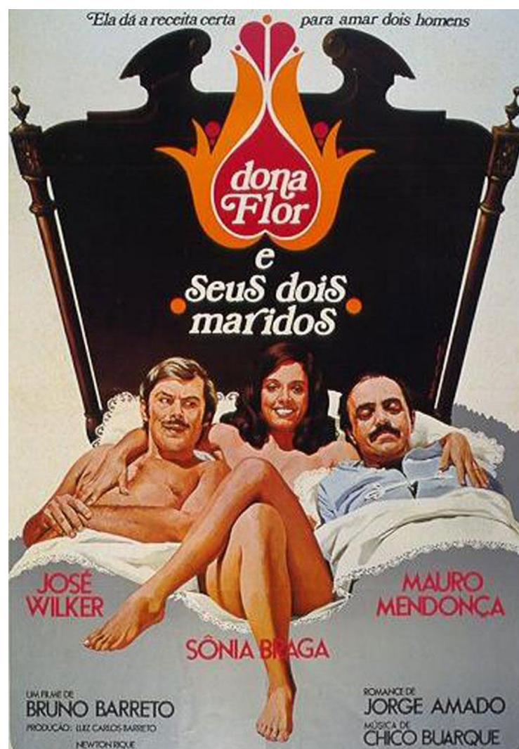
Figura 2 - Cartaz do filme Dona Flor e seus dois Maridos .

possível perceber seus contrastes, revelados pela oposição entre a casa e a rua. Para Damatta (2000), a casa é o lugar das tradições e, por compreender as relações entre entes queridos, estabelece o sentimento de familiaridade, de conforto e de proteção. A rua é um espaço arbitrário que representa a imposição das leis e gera um sentimento de impessoalidade nos indivíduos. O brasileiro vive, portanto, a dualidade entre a ideologia da casa e a da rua, assim como Dona Flor vivia entre a liberalidade de Vadinho e a contenção de Teodoro, conforme a representação visual do cartaz que anunciava o filme (figura 2):