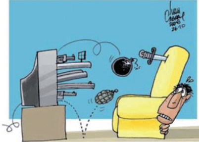
CABRAL, I. Disponível em: < http://www.ivancabral.com >. Acesso em: 18 jul. 2012.

DAHLBERG, L. L.; KRUG, E. G. Violência : um problema global de saúde pública. Disponível em: < http://www.scielo.br >. Acesso em: 18 jul. 2012 (adaptado).